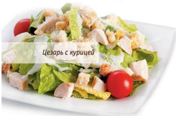
Цезарь с курицей