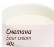
Сметана Sour cream 40г