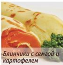
Блинчики с семгой и картофелем