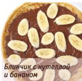
Блинчик с нутеллой и бананом