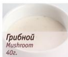
Грибной Mushroom 40г.