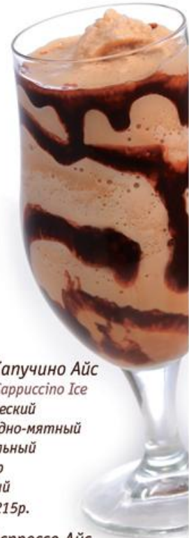
Дабл Капучино Айс Double Cappuccino Ice Классический Шоколадно-мятный Карамельный Пломбир Ореховый 400мл, 215р.