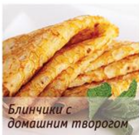
Блинчики с домашним творогом