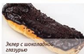
Эклер с шоколадной глазурью