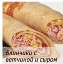
Блинчики с ветчиной и сыром

Блинчики с ветчиной и грибами 2 pancakes with ham and mushrooms Ветчина, грибы, сливки. 160г, 199р.