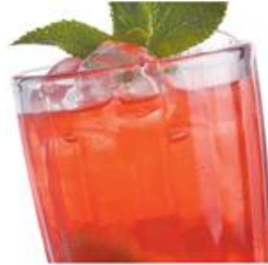
Домашний лимонад Lemonade Газированная вода, лимон, сироп, мята, лёд. 300мл, 149р.