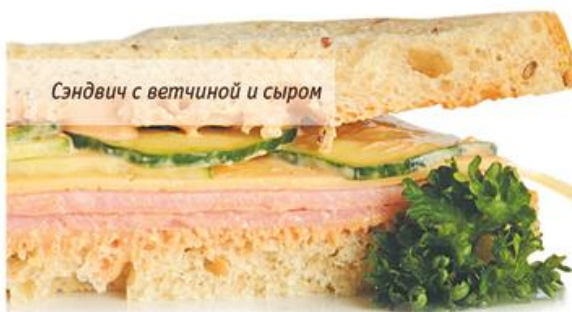
Сэндвич с ветчиной и сыром

Любой сендвич по вашему желанию можно приготовить на грилле.