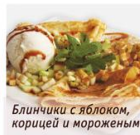
Блинчики с яблоком, корицей и мороженым

Блинчики с домашним творогом 2 pancakes with curd served with sour cream, condensed milk, honey or jam (at your choice) Два блинчика с начинкой из творога. Подаются со сметаной, сгущенным молоком, медом или вареньем (на выбор). 160г, 179р.