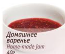
Домашнее варенье Home-made jam 40г

Любой топпинг или сироп (на выбор) 35р. Вкус уточните у официанта.