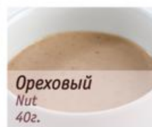
Ореховый Nut 40г.