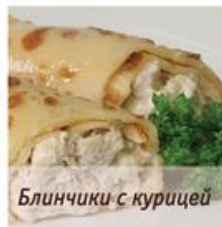
Блинчики с курицей