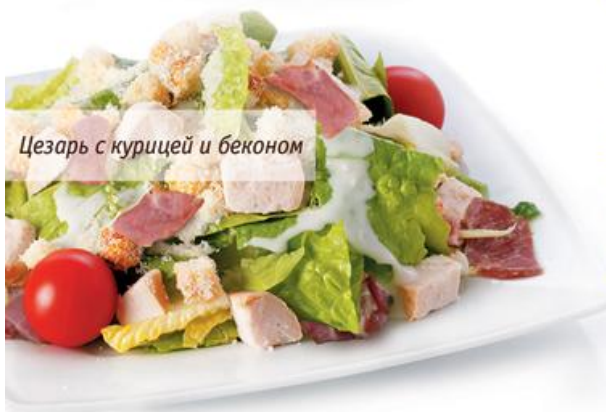
Цезарь с курицей и беконом