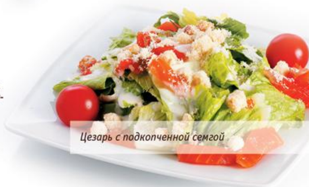
Цезарь с подкопченной сёмгой