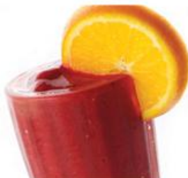
Ягодный микс Berry mix Малина, клубника, вишня, сироп «Гренадин», апельсиновый сок, долька апельсина 300мл, 235р.