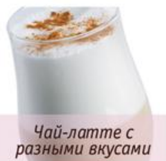
Чай-латте с разными вкусами