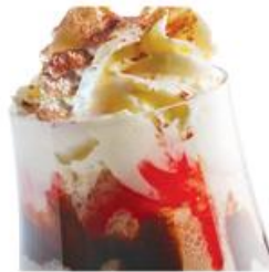
Фраппе «Эммануэль» Frappe Emmanuelle Эспрессо, сливки, мороженое, лёд, взбитые сливки, соусы. 400мл, 235р.