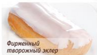
Фирменный творожный эклер