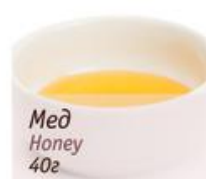
Мед Honey 40г