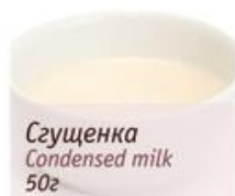
Сгущенка Condensed milk 50г