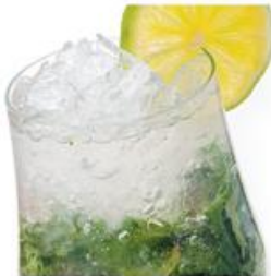
Мохито безалкогольный (классический, клубничный, и др.) Mojito non alcoholic (classic, strawberry, and other) Мята, лайм, 7АП, сироп, лёд. 360мл, 235р.