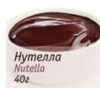
Нутелла Nutella 40г