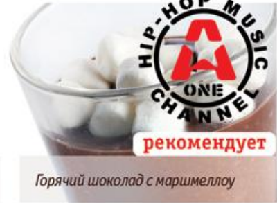
Горячий шоколад с маршмеллоу

Латте «Женьшень» Latte "Ginseng" 400мл. 229р.