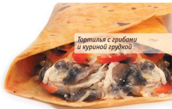
Тортилья с грибами и куриной грудкой

Тортилья с грибами и куриной грудкой Mushroom tortilla with chicken breast Тортилья, куриная грудка, грибной жульен, сыр. 190г, 209р.