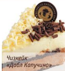
Чизкейк «Дабл Капучино»