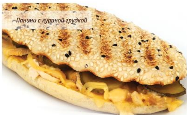
Панини с куриной грудкой

Панини с куриной грудкой в соусе карри Panini with chicken breast and curry sauce Панини с кунжутом, куриная грудка, маринованные огурчики, сыр «Эдам», соус карри. 180г, 219р.