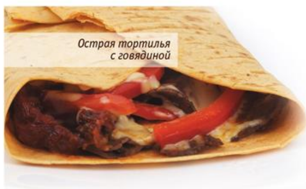
Острая тортилья с говядиной

Острая тортилья с говядиной Spicy tortilla with beef Тортилья, говядина, помидоры вяленые на солнце, сыр эдам, перец болгарский, соус барбекю, соус тако острый. 190г, 209р.