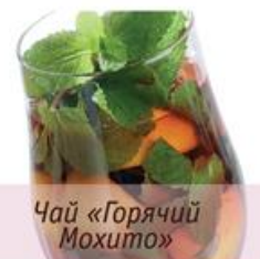
Чай «Горячий Мохито»