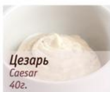
Цезарь Caesar 40г.