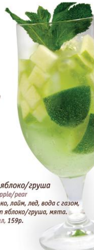
Айс яблоко/груша Ice apple/pear Яблоко, лайм, лёд, вода с газом, сироп яблоко/груша, мята. 360мл, 159р.