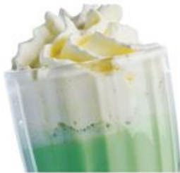
Баунтис Bounties Молоко, миндально-фисташковое мороженое, сиропы, взбитые сливки. 350мл, 235р.