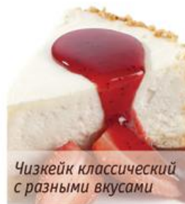
Чизкейк классический с разными вкусами

Чизкейк «Дабл Капучино» Cheesecake «Double Cappuccino» 145г. 209р.