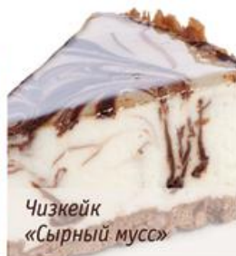
Чизкейк «Сырный мусс»