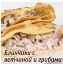
Блинчики с ветчиной и грибами