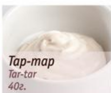
Тар-тар Tar-tar 40г.