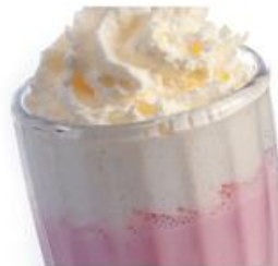
Шейки Shakes 350мл, 199р. (шоколадный, клубничный, банановый, ванильный)