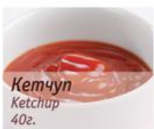
Кетчуп Ketchup 40г.