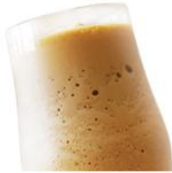
Латте «Женьшень» Айс Latte Ginseng Ice Ристретто, смесь женьшень, молоко, лёд. 400мл, 235р.