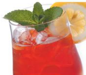
Чай со льдом с разными вкусами на выбор Iced tea special 400мл, 199р.