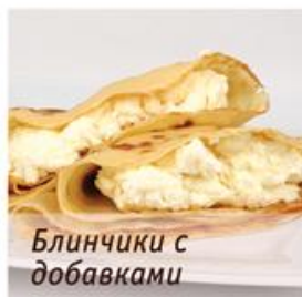
Блинчики с добавками