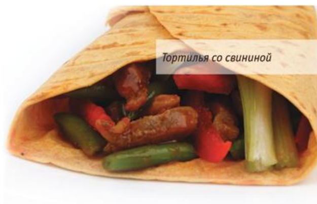
Тортилья со свиной

Тортилья со свиной в кисло-сладком соусе Tortilla with pork in sweet and sour sauce Тортилья, свинина, сельдерей черешковый, перец болгарский, фасоль стручковая, соус чили, соус кисло-сладкий. 180г, 209р.