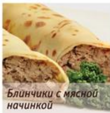
Блинчики с мясной начинкой